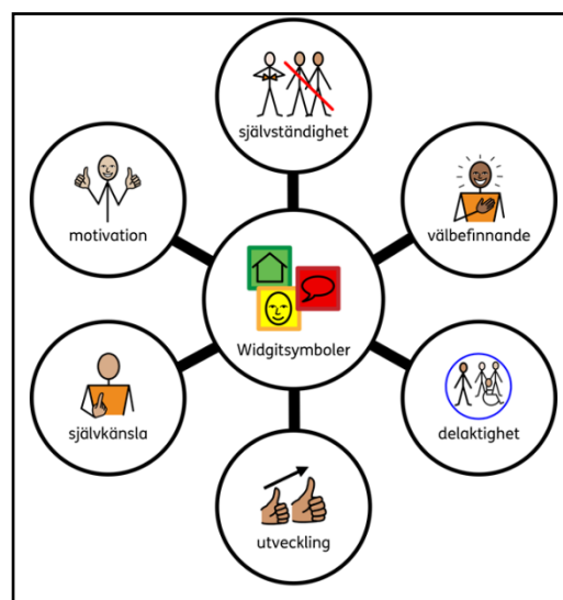
Bildexempel från Ritade tecken.