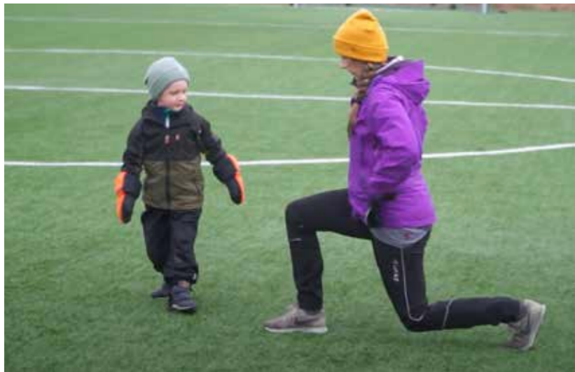
Filmade träningstips från Sävar IK.