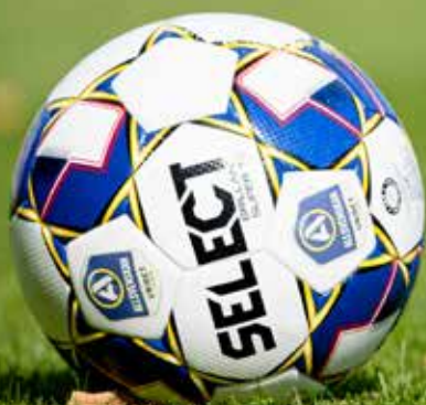
Fotbollsskola, i samverkan med föreningslivet, är en av de aktiviteter som erbjudits under Karlskogaandan.