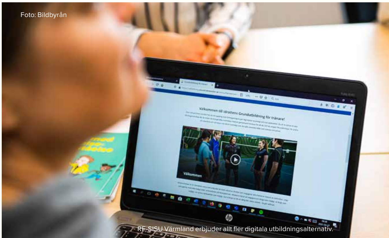
RF-SISU Värmland erbjuder allt fler digitala utbildningsalternativ.