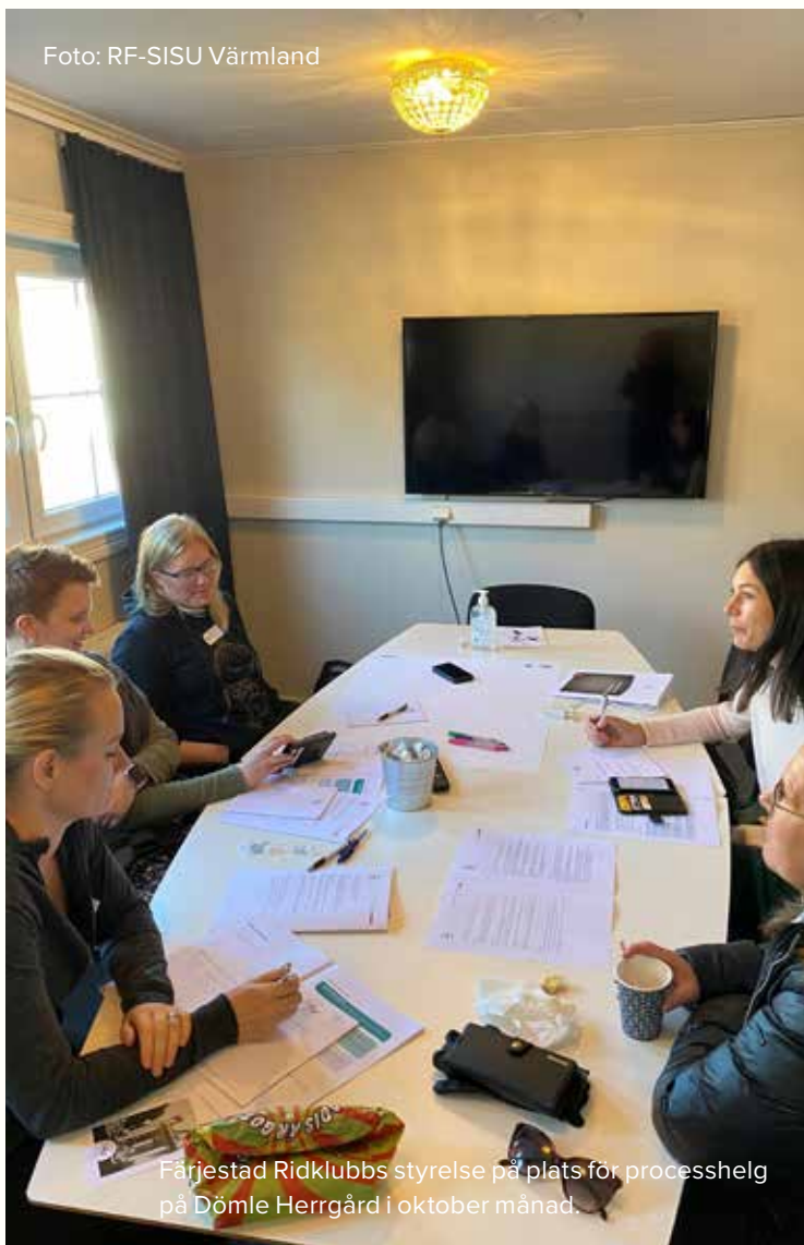
Färjestad Ridklubbs styrelse på plats för processhelg på Dömle Herrgård i oktober månad.